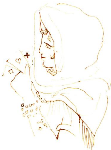
Dessin de Jean Cocteau

MARIES-DE-LA-MER À L'ÉPOQUE DU PELERINAGE